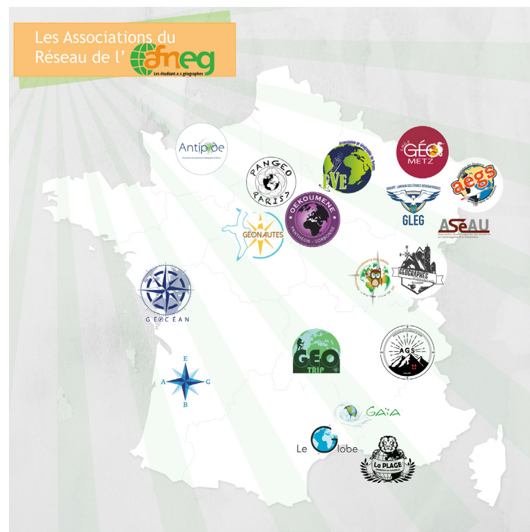
Le réseau composé de 18 associations

L'AFNEG exerce également des activités de représentation et veut être une force de proposition sur les sujets d'actualité concernant les étudiant.e.s en géographie, mais aussi ceux en devenir et en travaillant sur la pertinence de l'enseignement géographique au lycée. Elle souhaite informer les étudiant.e.s sur les offres de formations et mener toute action permettant de favoriser leur orientation et insertion professionnelle.